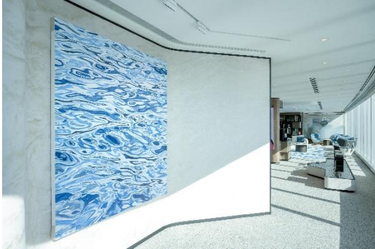
File name: Installation view_5.jpg

龍全作品於「Chubb 1792 Club」的展覽現場