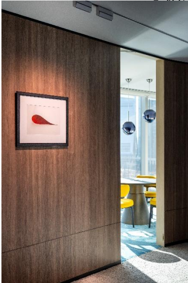
File name: Installation view_6.jpg

沃爾夫岡·提爾曼斯作品於「Chubb 1792 Club」的展覽現場