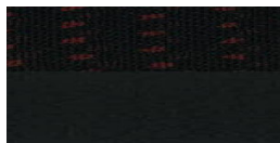
MPS – cuir